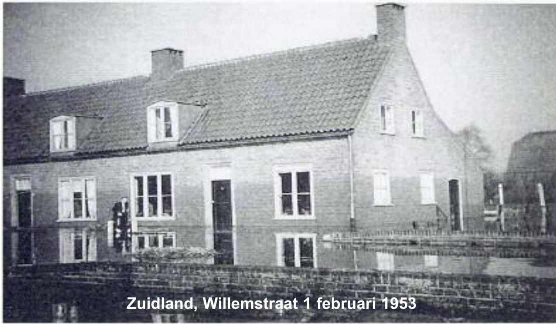
Zuidland, Willemstraat 1 februari 1953